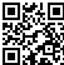
本隊網站 QR Code