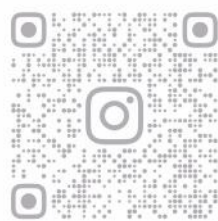
本隊instagram QR Code