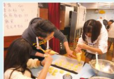
義工們很努力咁製作曲奇送 給長者