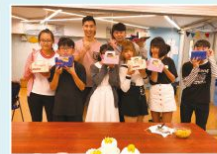
參加者完成了飽餅訓練後都 顯得很滿足

本隊獲社會福利署資助舉辦「與愛同行」--沙田區青年社區 大使協助計劃, 於2018年11月至12月期間, 舉辦了飽餅訓練 小組, 學習飽餅製作技巧, 並透過義工探訪活動, 將製作的 飽餅送贈給區內長者, 長者收到年青人的心意都表現得很開 心。